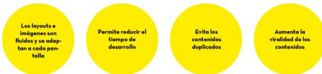
Fig. 4. Características del Diseño Responsive.

Se basa en proporcionar a todos los usuarios de una web los mismos contenidos y una experiencia de usuario lo más similar posible, frente a otras aproximaciones al desarrollo web móvil como la creación de apps, el cambio de dominio o webs servidas dinámicamente en función del dispositivo.