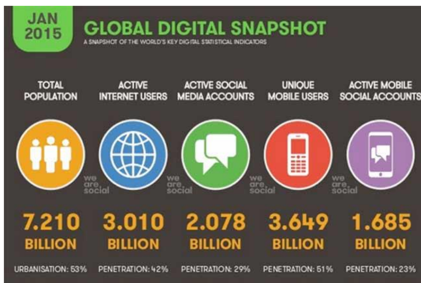
Fig. 3. Estadística de Digital, Social & Mobile Worldwide in 2015

A nivel mundial el tráfico en los dispositivos móviles ha aumentado de forma impresionante, con un promedio mundial de 98% y de 126% en Suramérica. Pero en México, ¿Cómo se comporta esta estadística?, Según el estudio de Consumo de Medios y Dispositivos entre Internautas Mexicanos, presentado por IAB México y Millward Brown en el 2014, los internautas mexicanos interactúan con un mayor número de dispositivos, los encuestados declaran tener 4 dispositivos diferentes en promedio y utilizan 3 para conectarse: laptop (70%), smartphone (62%) y tablet (35%), mismos dispositivos que son la vía de conexión preferida de los internautas con 34%, 30% y 9% respectivamente[7].